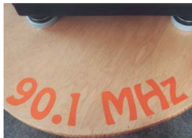
Diebstahlgesichertes Gerät auf markiertem Tisch bei RUM